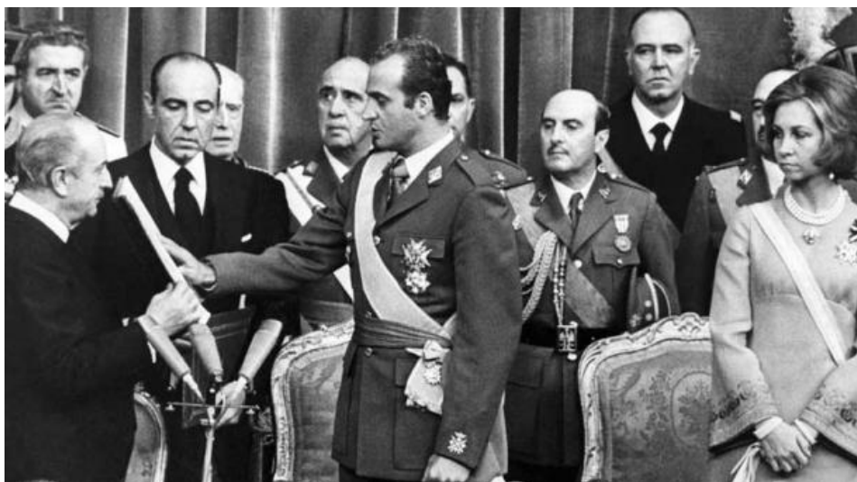
Jurament del rei Joan Carles I davant el president de les Corts (1975)