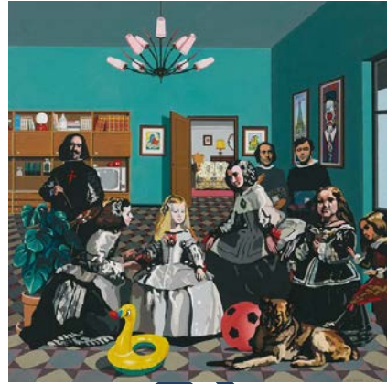
Imatge 2. Equip Crónica. "La salita" 1970, acrílic sobre llenç, 200 x 200 cm