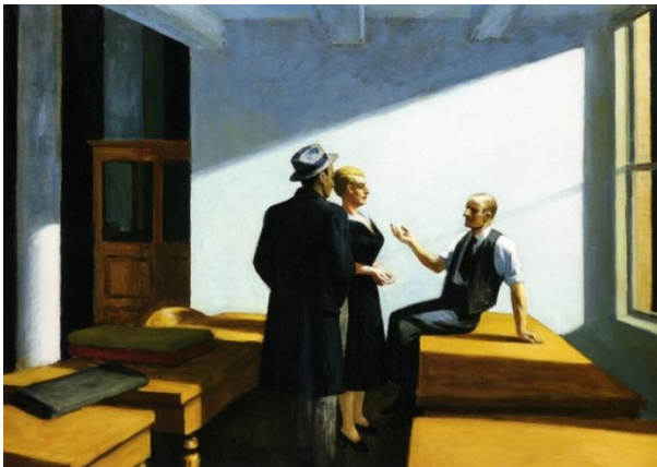
Imatge 3. Edward Hopper. "Reunión nocturna" 1949, oli sobre llenç, 101,6 x 70,49 cm.